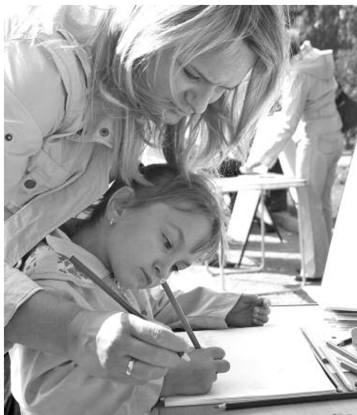
(Продолжение на стр. 23).

В минувшую субботу все горожане, пришедшие в Первомайский сквер, стали не только зрителями, но и активными участниками четвертой общегородской акции «Новосибирск против насилия и наркотиков». В середине дня, когда погода разгулялась, и ярко засветило солнце, практически вся центральная часть парка превратилась в площадку, на которой можно было послушать любимую музыку и посмотреть впечатляющие выступления воспитанников военно-спортивных клубов и школ.