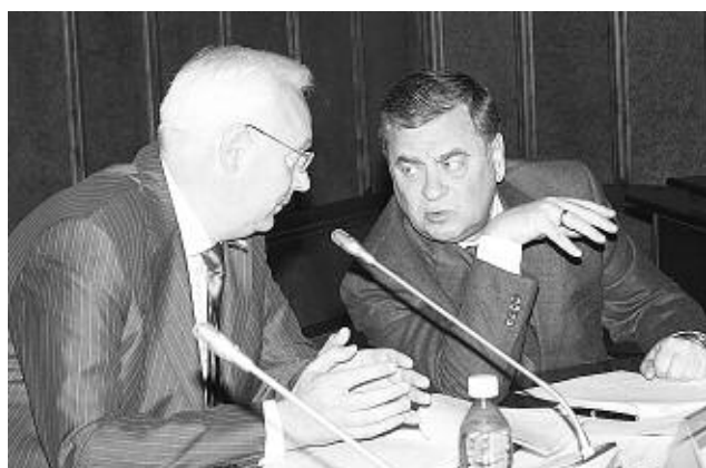
Председатель комитета Александр Савельев и вице-спикер Евгений Покровский.